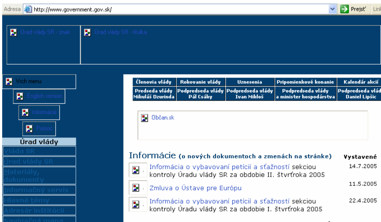
Obrázok 1 – Domová stránka Úradu vlády zobrazená v textovom prehliadači.